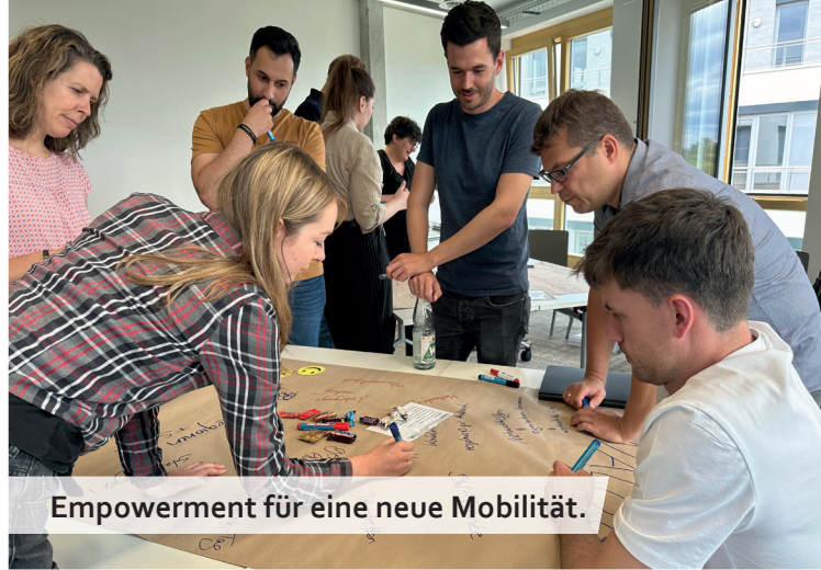
Empowerment für eine neue Mobilität.