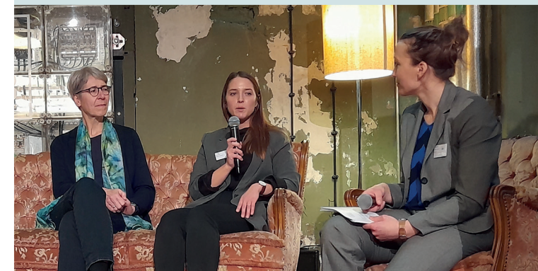
Kompetenzen bündeln. Akteure vernetzen.