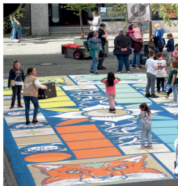
Veränderung erleben und ausprobieren.